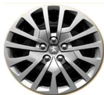
16"-os díztárcsa (Business)