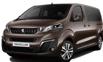
Barna RICH OAK