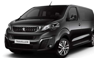
Fekete PERLA NERA

Az itt megjelenített képek illusztrációk.