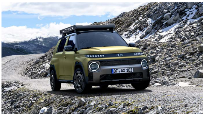
INSTER Cross, Tetőbox-szal