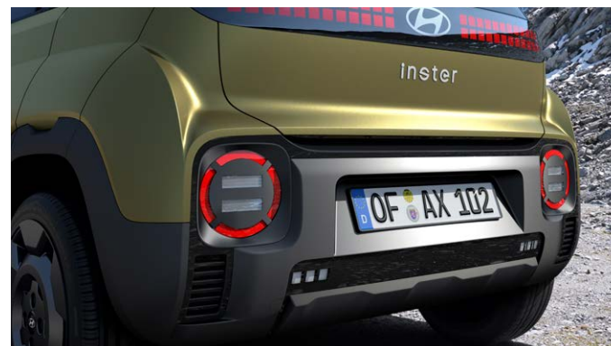
INSTER Cross hátulnézet