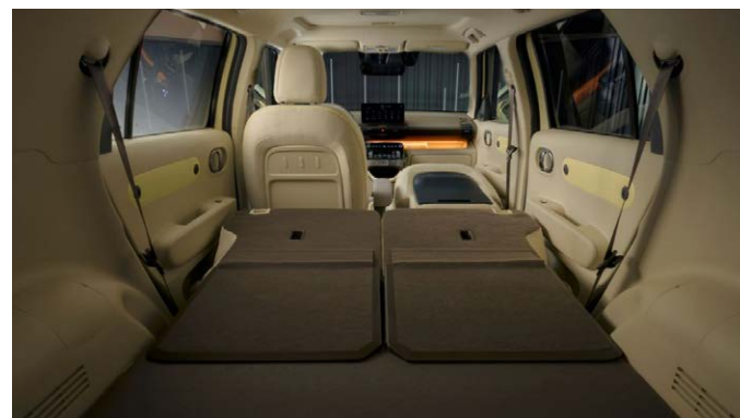
Lehajtott ülések, csomagter padlóval